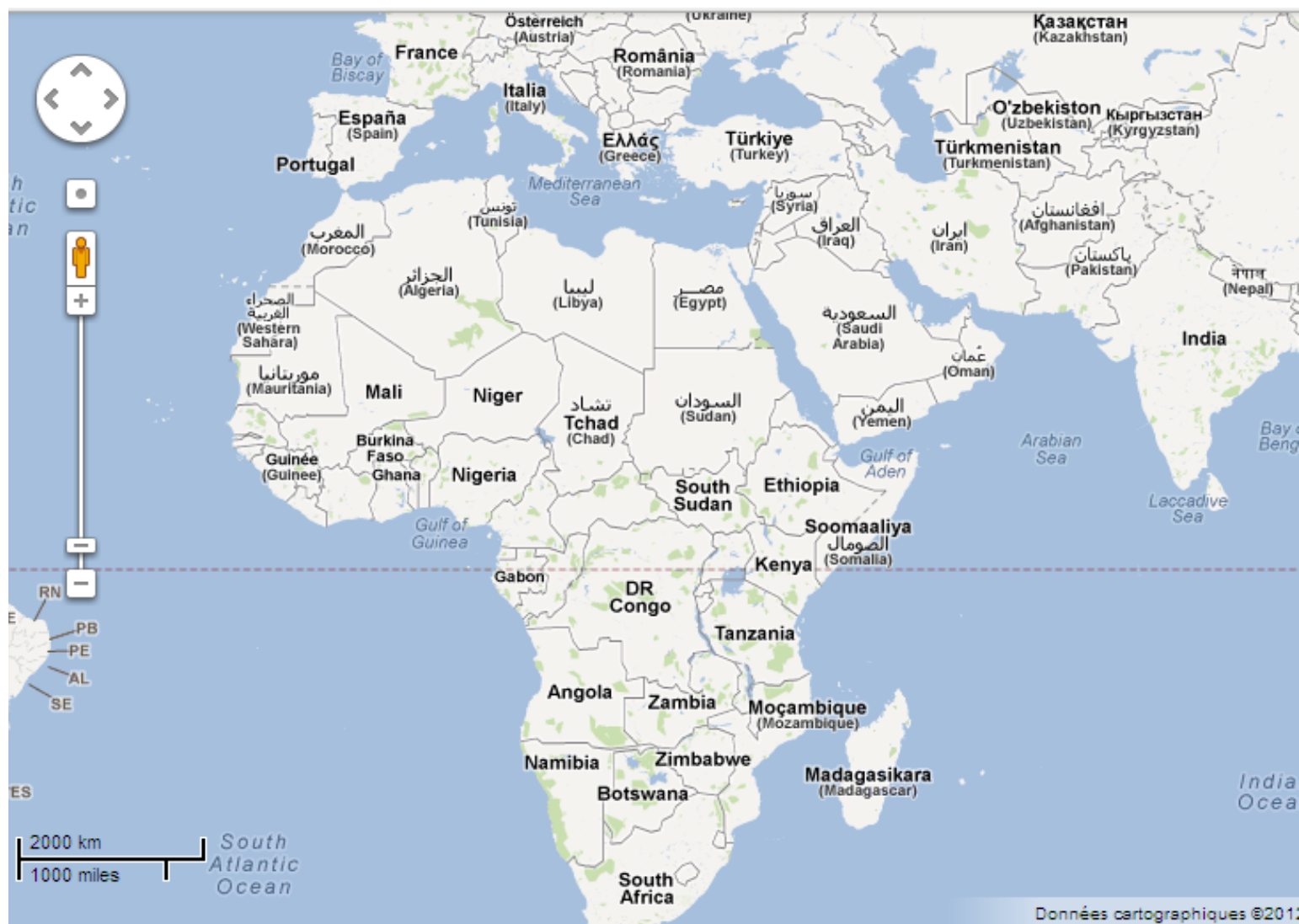
Localisation des cigognes pendant l'année grâce à une balise Argos