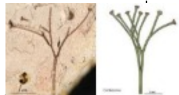
1ers végétaux terrestres -450 M