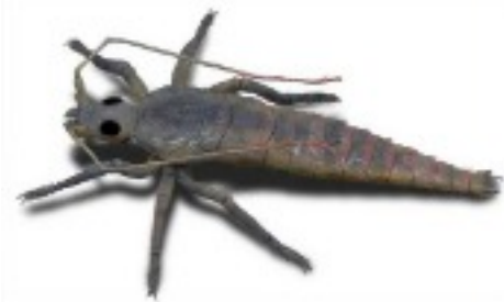
premiers arthropodes terrestres -430 M