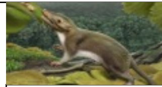
premiers mammifères -205 M