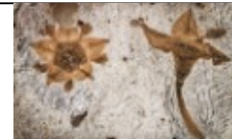
1ères plantes à fleurs -125 M