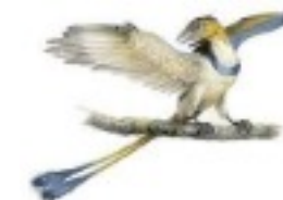
premiers oiseaux -150 M