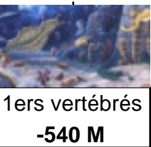
1ers vertébrés -540 M