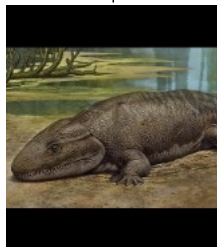
premiers vertébrés terrestres -355 M