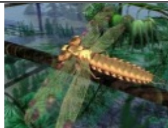
premiers insectes aillés -310 M